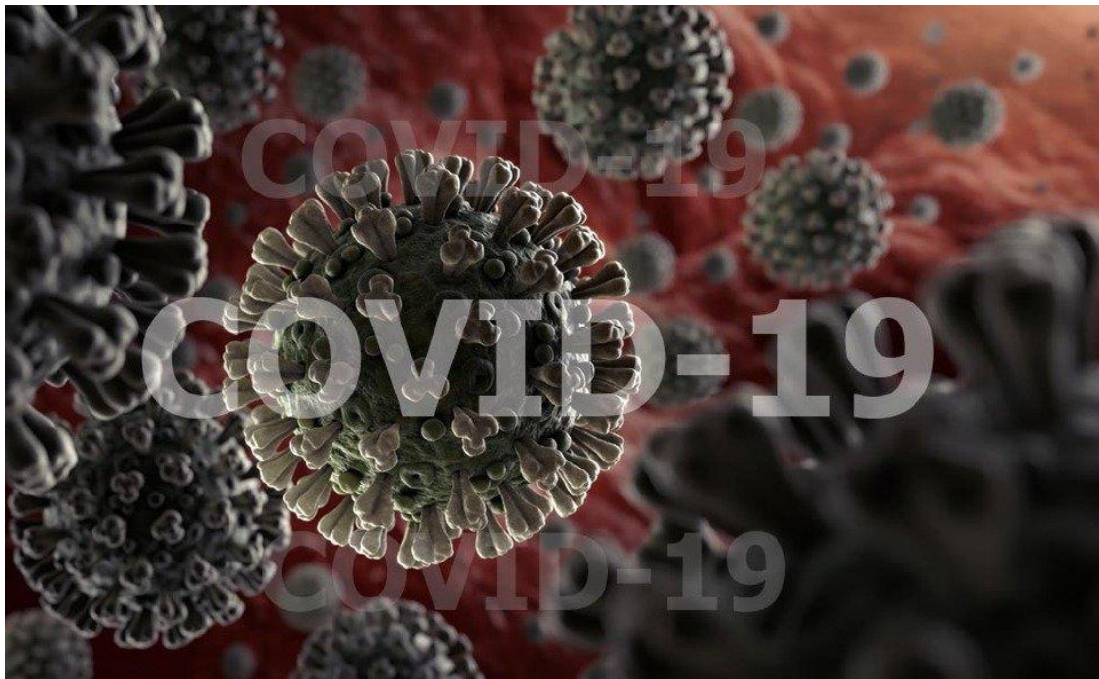
Rajah 1: Ilustrasi mikroskopik penyebaran virus Covid-19 di Wuhan, China

Wabak Covid-19 yang mula dikesan pertengahan Disember 2019 di bandaraya Wuhan, China dan diiktiraf sebagai pandemik oleh Pertubuhan Kesihatan Dunia (WHO) pada 11 Mac 2020 telah menyerang bukan setakat negara Malaysia tetapi juga seluruh dunia sehingga memberi kesan yang buruk kepada ekonomi negara.