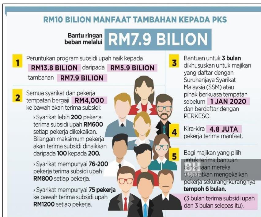
Rajah 6: Manfaat Tambahan Kepada PKS (BH Online, 7 April 2020)

https://www.bharian.com.my/berita/nasional/2020/04/673996/kerajaan-pastikan-pks-dapat-semua-manfaat