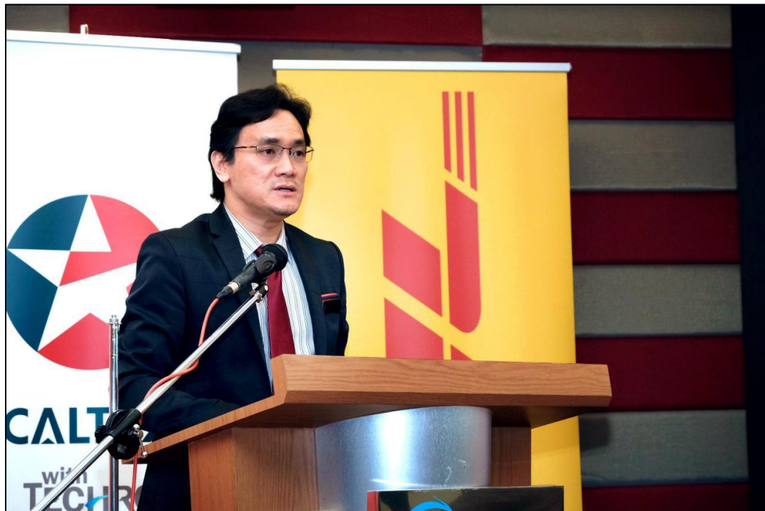
Rajah 4: PKS bangkit paling cepat daripada impak Covid-19 (Kosmo, 3 Ogos 2020)

Ketika ini, negara mempunyai sebanyak 907,000 perusahaan kecil dan sederhana (PKS). Kementerian Pembangunan Usahawan (MED), Datuk Seri Mohd Redzuan Md Yusof berkata sumbangan perusahaan kecil dan sederhana pada tahun 2019 mencatatkan 38 peratus kepada Keluaran Dalam Negara Kasar (KDNK) (MyMetro, 22 Mac 2019). beliau juga mendasarkan kenaikan sebanyak 41 peratus sumbangan perusahaan kecil dan sederhana (PKS) kepada ekonomi negara pada tahun 2020.