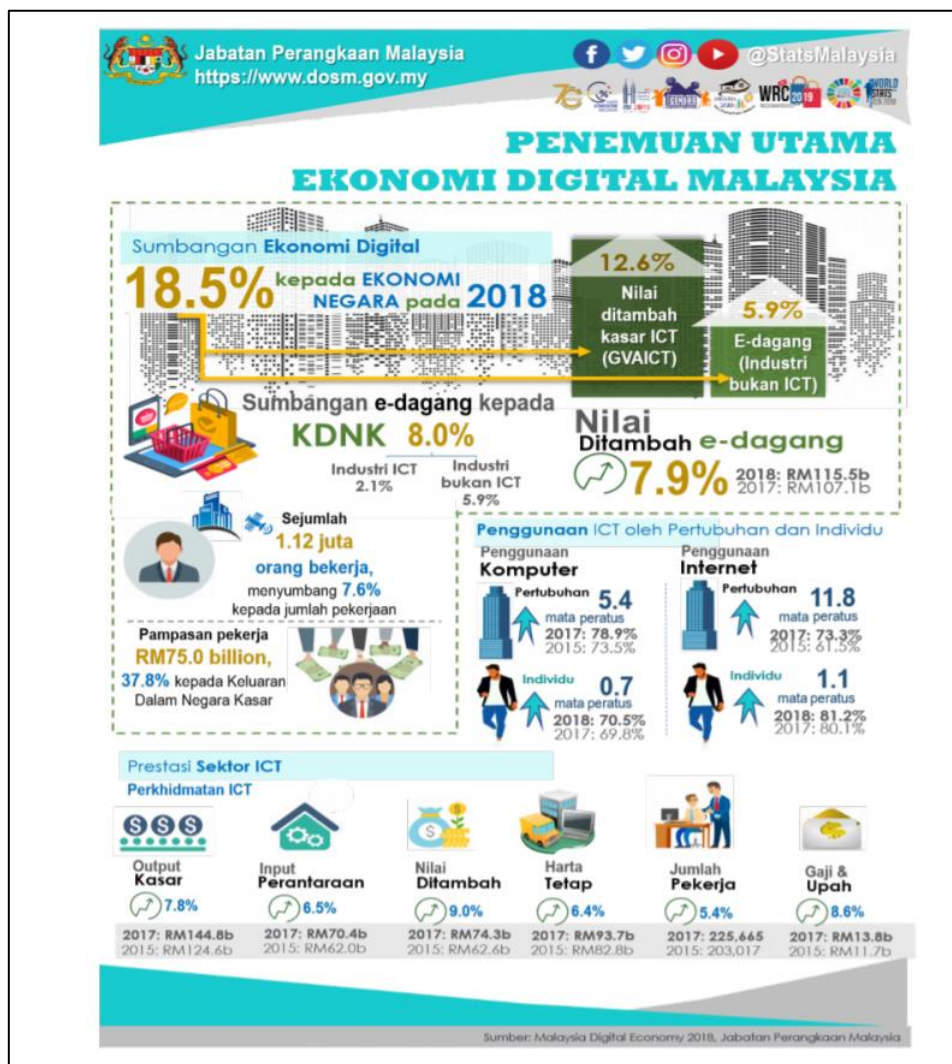
Rajah 7: Penemuan Utama Ekonomi Digital Malaysia (Ekonomi Digital Malaysia, 2018) Sumber: Jabatan Perangkaan Malaysia (16 Oktober 2019)

Pakej Rasangan Ekonomi Prihatin Rakyat (PRIHATIN) serta pakej tambahan PKS sebanyak RM10 bilion yang disediakan kerajaan sangat dialu-alukan serta harus diteruskan dan membuat penambahbaikan dari segi jumlah bantuan serta memastikan bantuan tersebut sampai kepada golongan yang layak. Mendigitalkan proses-proses ini akan membolehkan ketelusan yang lebih besar dalam mengesan kelayakan pemohon.