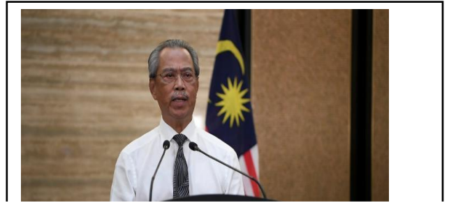
Rajah 2: Perdana Menteri, Tan Sri Muhyiddin Yassin, mengumumkan Perintah Kawalan Pergerakan 18 Mac 2020

Pada 13 Mac 2020 Perdana Menteri Malaysia Tan Sri Muhyiddin Yassin telah mengumumkan Perintah Kawalan Pergerakan (PKP) selama 14 hari bagi mencegah penyebaran wabak ini secara berperingkat. Pada waktu tersebut hanya beberapa perniagaan yang dibenarkan untuk beroperasi seperti kedai yang membekalkan peralatan dan keperluan harian dan perkhidmatan awam seperti hospital. Walaupun hampir semua perniagaan tidak dapat beroperasi namun masalah kewangan sebuah perniagaan pada awalnya tidak berapa terjejas.