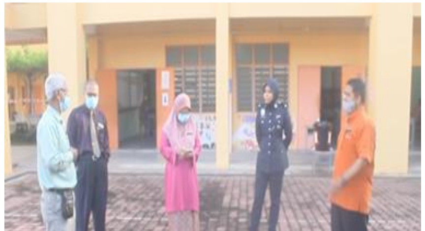
Pihak berwajib yang turun padang semasa pembukaan sekolah

Oleh hal demikian, pihak SMK Bongor mengikut prosedur SOP yang ditetapkan bagi memastikan keselamatan pelajar lebih terjamin. Selain itu, pihak sekolah turut bekerjasama dengan Balai Polis daerah Baling dan Pejabat Pendidikan Daerah Baling. Hal ini bertujuan bagi memantau keadaan sekolah untuk mengelakkan perkara-perkara yang tidak diinginkan dan membuat laporan keadaan sekolah selepas penerimaan pelajar semula.