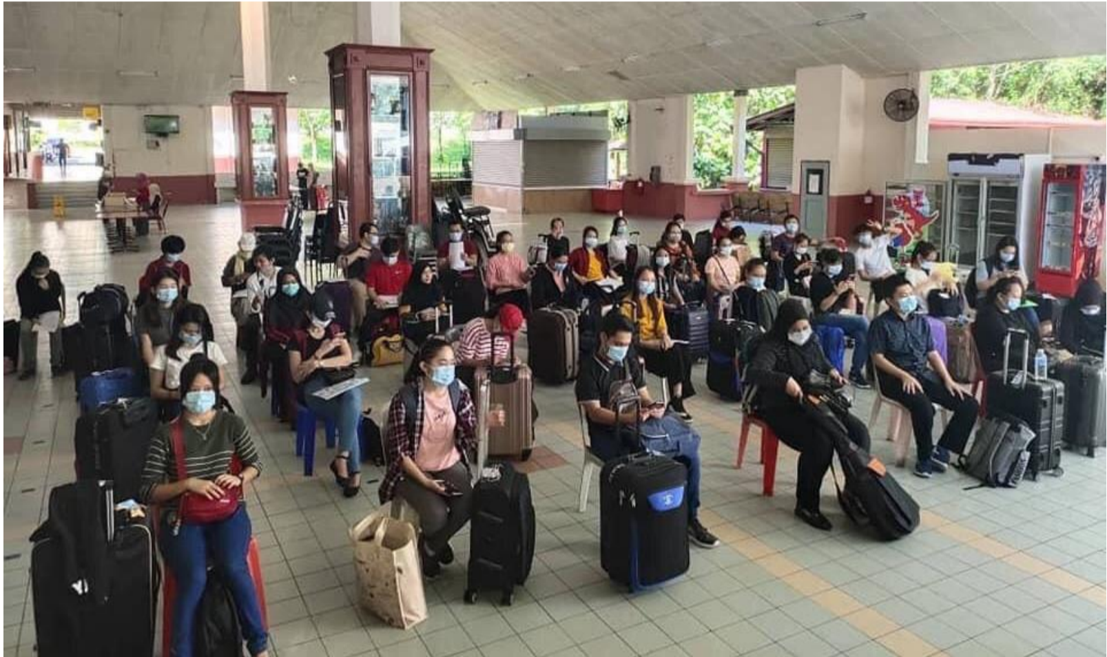
Para pelajar UMS yang menunggu giliran untuk pulang ke kampung halaman ketika PKP.