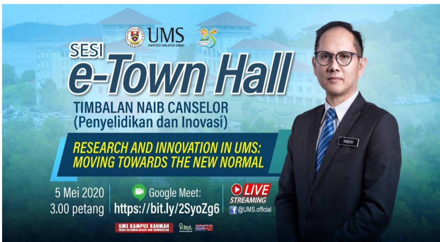
Poster Sesi E-Townhall bersama Timbalan Naib Canselor- laman rasmi facebook UMS