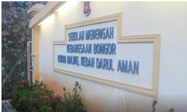
Papan tanda nama Sekolah Menengah Kebangsaan Bongor

BALING (24 Jun)- Sekolah Menengah Kebangsaan Bongor dibuka semenjak 24 Ogos 2010. Ia juga merupakan sekolah yang berada di kawasan luar bandar. Penerima sekolah tersebut kepada pelajar sebanyak satu ribu pelajar.