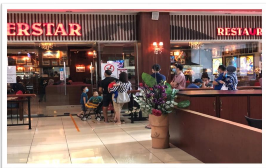
Customers checking their temperature before entering a restaurant in 1 Borneo Mall.

In contrast with the first few phases of MCO, where only stores that provided basic necessities such as some restaurants and grocery stores, could operate normally, however with certain rules such as dine in at restaurants are prohibited, customers can only order take outs. Other than that, the rest of the shops were closed.