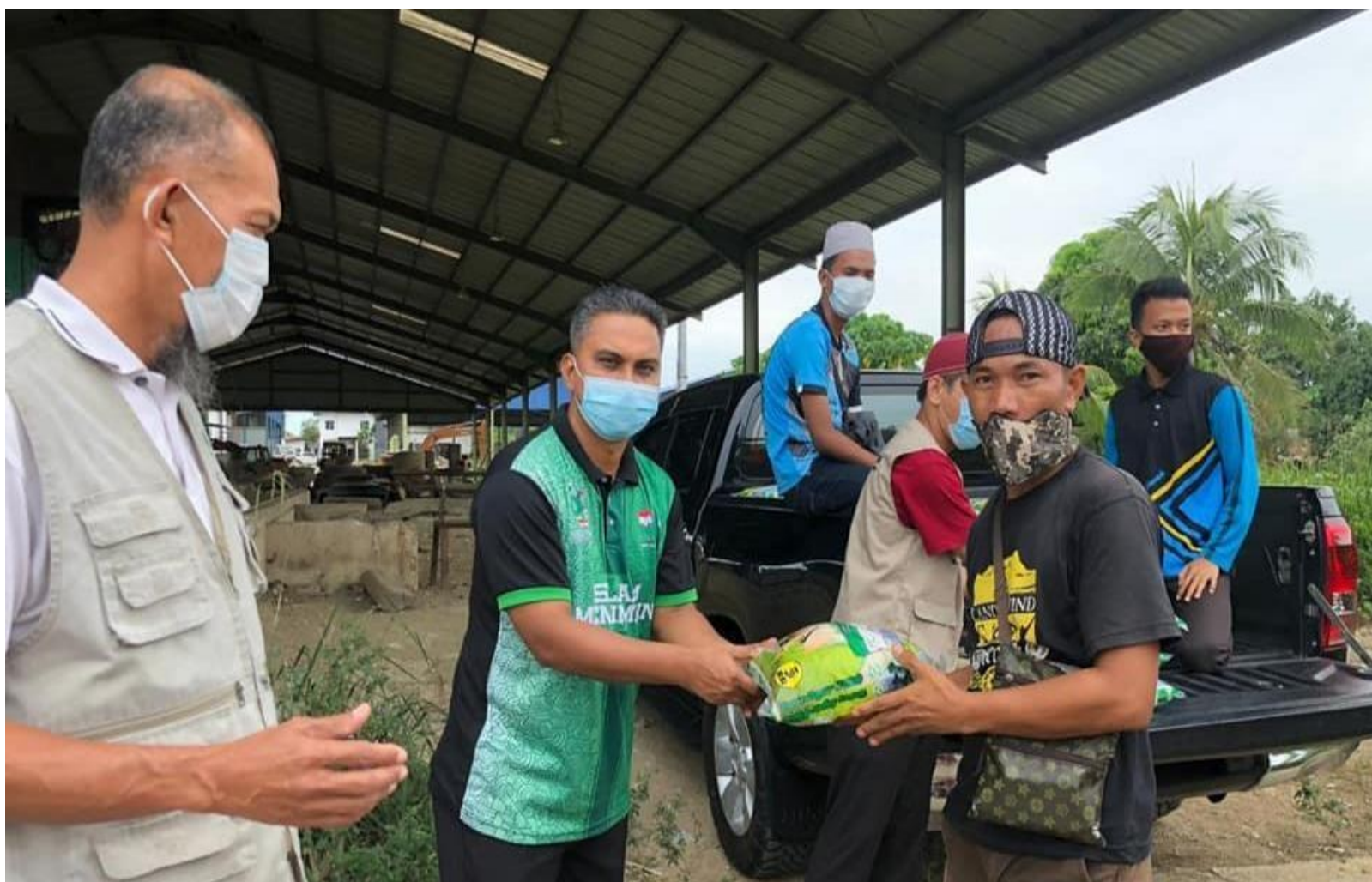
Wakil PAS Kawasan Libaran memberikan sumbangan kepada penduduk Kampung Sampah, Sandakan.