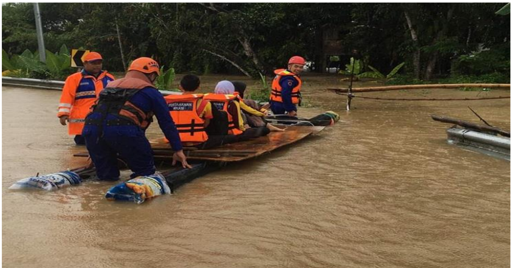
Pasukan penyelamat sedang menyelamatkan mangsa banjir di kawasan perkampungan kota belud untuk dihantar ke tempat yang disediakan iaitu Dewan Tun said Keruak

Oleh: NUR HAFIDAH BINTI JARATUL BA18110820