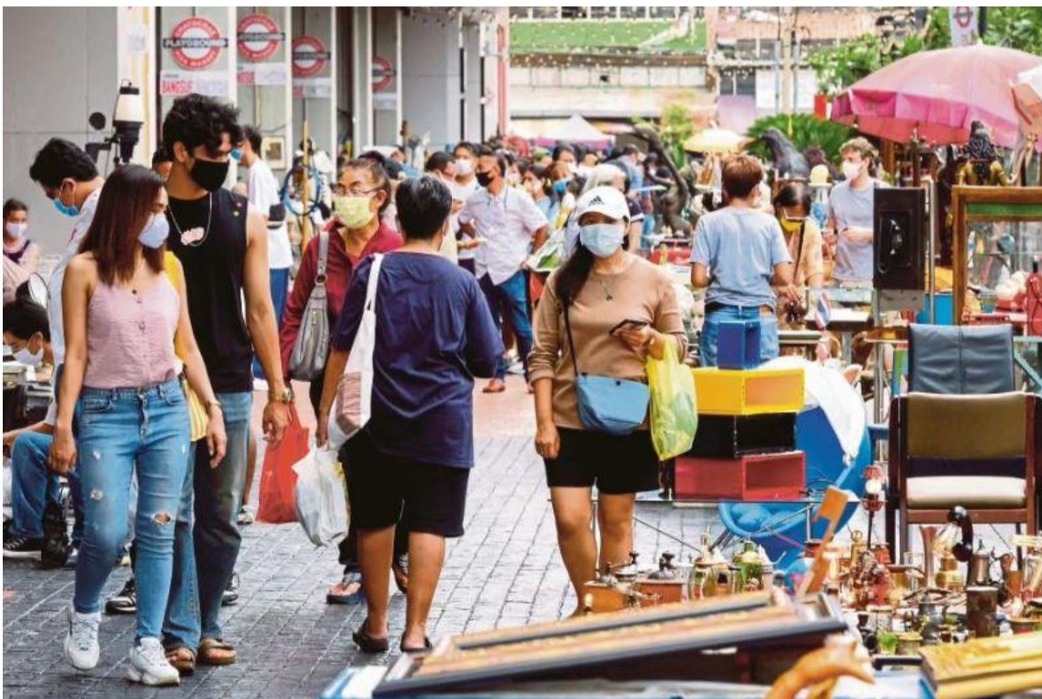
Pengunjung mematuhi operasi standard(SOP) dengan memakai pelitup muka.

Oleh: NORHIDAYAHTULAIMEY BINTI ABDULLAH BA18110825