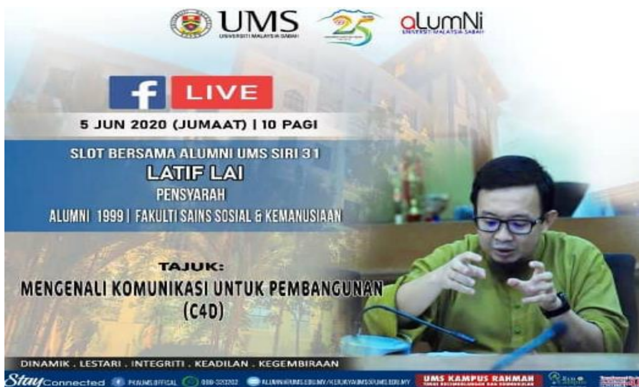
Poster menunjukkan tarikh dan masa berlangsungnya live bersama dengan Encik Latif Lai