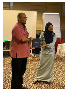
Simbolik penyerahan tugas oleh Dekan FSSA kepada Dekan FPT