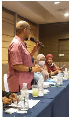
Ucapan alu-aluan dan tahniah daripada Dekan FSSA