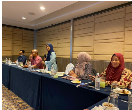
Ucapan balas daripada Dekan FPT