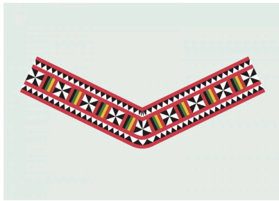
Gambar motif Bajau Sama berbentuk V yang dikaji oleh kumpulan penyelidik akan kegunaannya.

Corak bagi motif Bajau Sama juga dibentuk berpandukan kaedah yang dinyatakan di mana corak pada motif tradisional rumpun Bajau Sama.